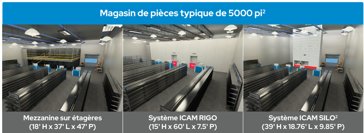
Magasin de pièces typique de 5000 pi 2