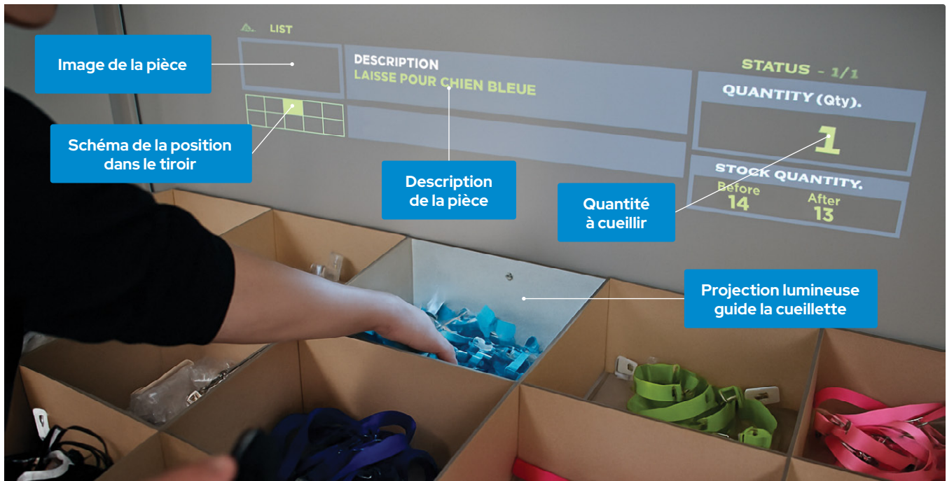
Image de la pièce